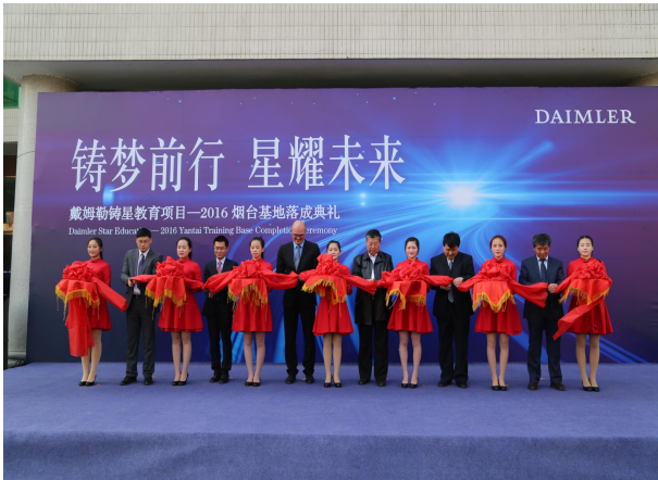
戴姆勒职业教育项目