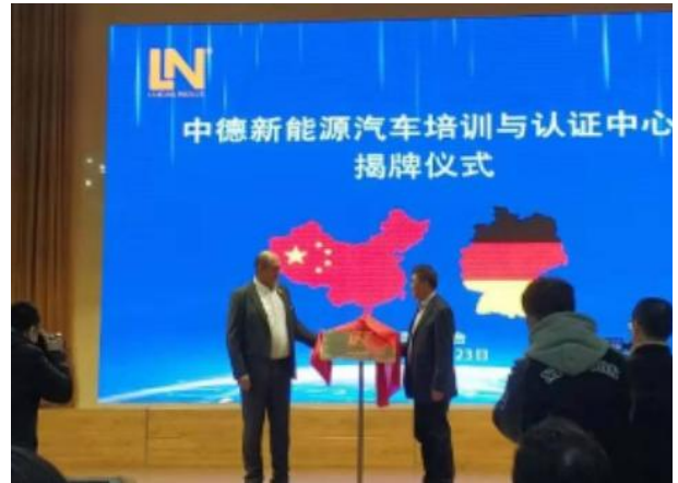
中德新能源汽车培训与认证中心