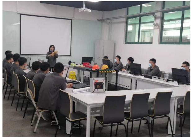
中德新能源汽车培训与认证中心学生培训