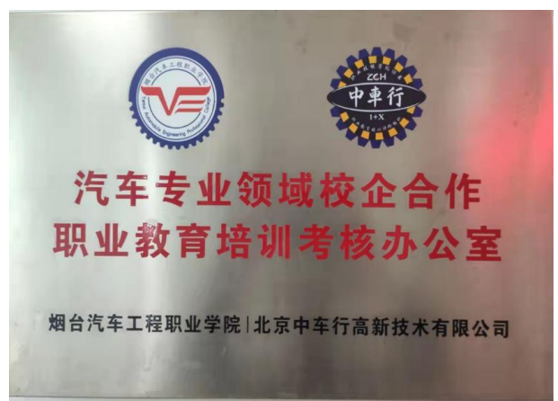
1+X 汽车专业领域职业教育培训考核办公室