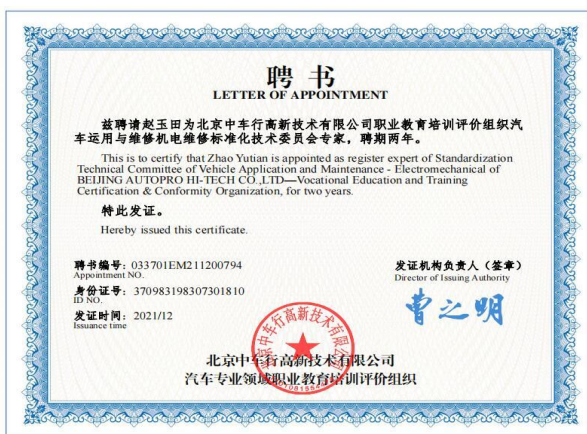
1+X 标准化技术委员会专家