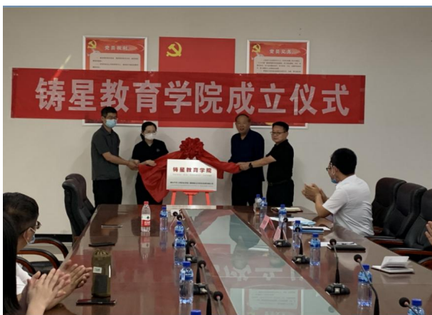
戴姆勒铸星教育学院成立