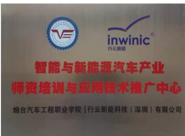
技术应用与推广中心授牌