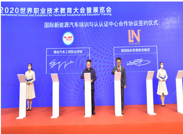
世界职业技术教育大会