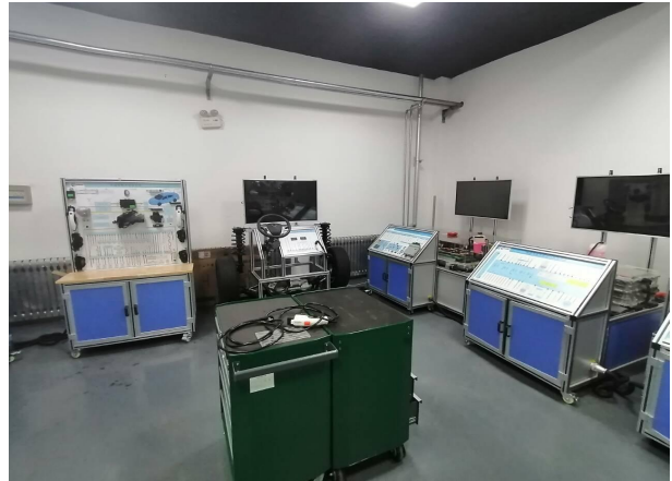
比亚迪实训基地设备