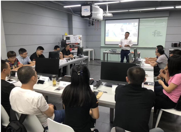
中车新能源汽车培训与认证中心开展培训