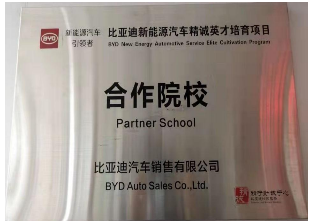
比亚迪精诚营销校企合作项目