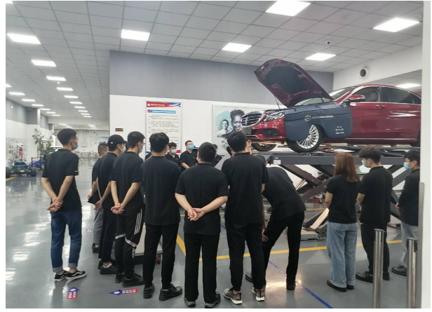
戴姆勒职业教育项目学生培训